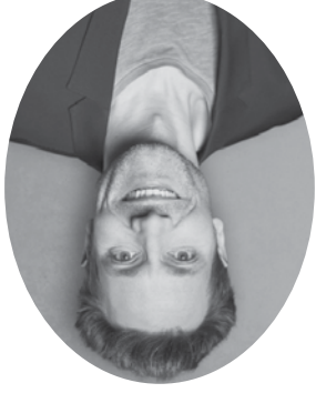
Ludwig Hartmann Vizepräsident des Bayerischen Landtages